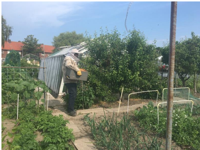
Imker Piet op tuin 18 waar de zwerm geland was

Een paar weken geleden ging er op zondagochtend een zwerm bijen vandoor bij imker Piet op ons complex. In de maand mei is dit een veel voorkomend verschijnsel.