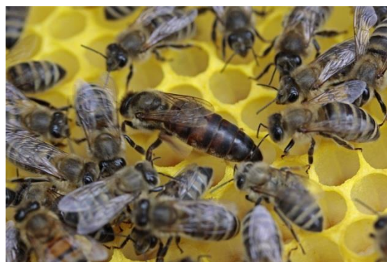
Koningin is zeer groot!

Is het volk niet sterk genoeg meer om zich zo veel luxe te permitteren, dan worden de extra jonge koninginnen (poppen) door het volk gedood, soms zelfs in directe tweestrijd tussen de jonge zusterkoninginnen. Met het oude volk op de oude plek krijgt zo'n jonge koningin een droomstart, in een voldoende groot volk. Het volk leeft op een succesvolle plek, omdat het volk anders nooit zo groot geworden zou zijn dat het kon zwermen.